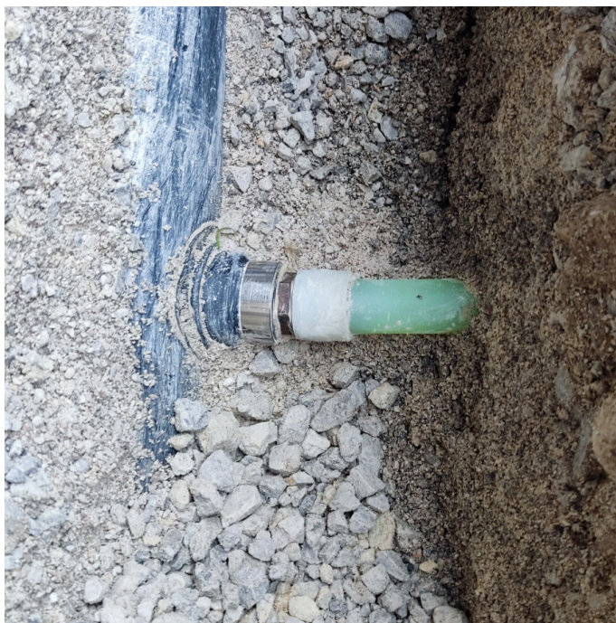
Slika izvedbe spoja med kolektorjem in stransko cevjo